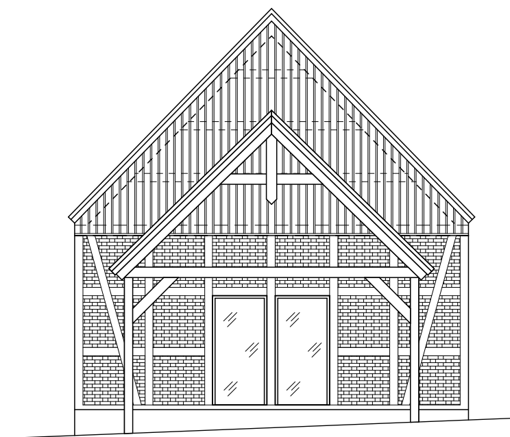
elewacja zachodnia projektowana